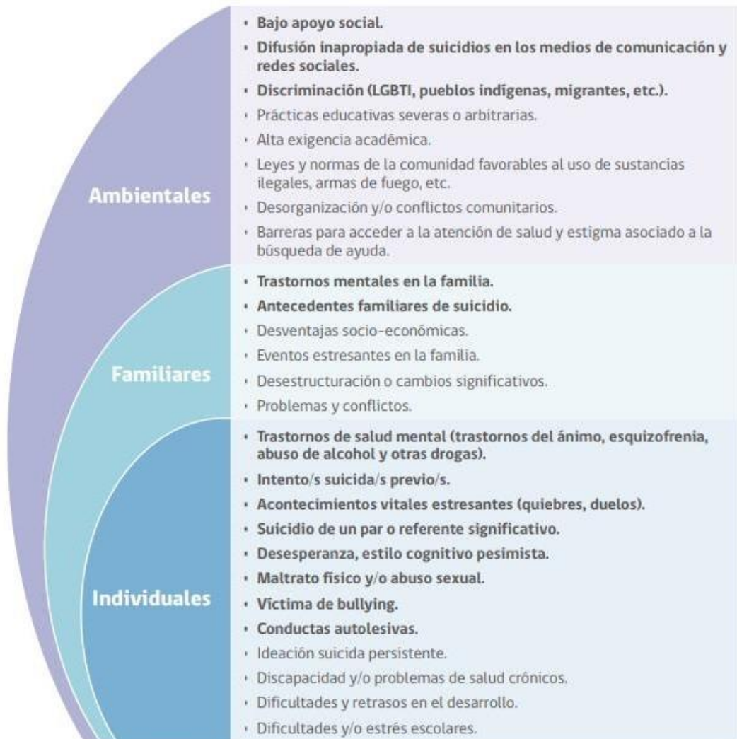
FIGURA 1. FACTORES DE RIESGO CONDUCTA SUICIDA EN LA ETAPA ESCOLAR