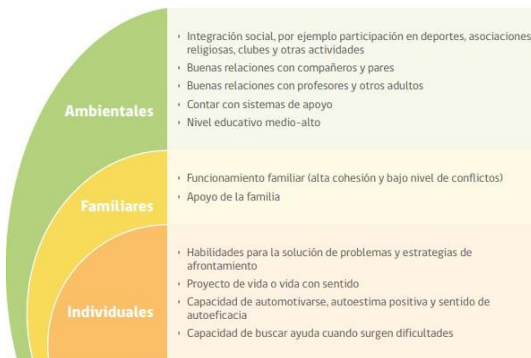
FIGURA 2. FACTORES PROTECTORES CONDUCTA SUICIDA EN LA ETAPA ESCOLAR

Fuente: Elaboración propia en base a Manitoba's Youth Suicide Prevention Strategy & Team, 2014; Ministerio de Sanidad, 2012; OMS, 2001.